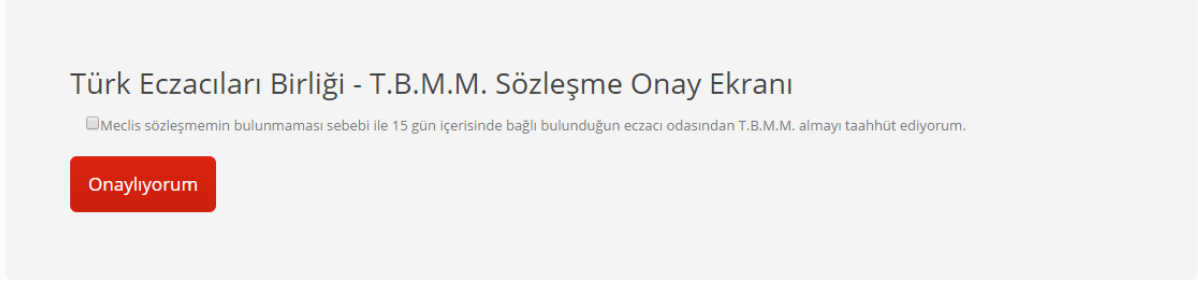
Resim - 1

Bu işlem adımları TBMM sözleşmesi olmayan eczacılar için geçerlidir.